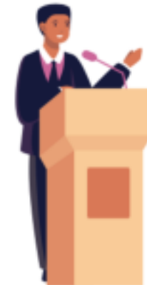
INSPIRATIE & NETWERK EVENTS